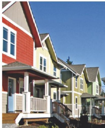
Lotissement de 14 maisons individuelles réalisées par le CLT Kulshan à Bellingham (état de Washington) : le CLT a négocié avec la ville de façon à densifier le site (augmentant de 50 % le nombre de maisons), sans pour autant renoncer à la dimension durable (éco-construction, coût acceptable, habitat à 2 pas des facilités urbaines)

L'économie mixte est-elle en mesure de se fondre au sein d'un modèle immobilier non spéculatif de cette nature en espérant y trouver son propre renouveau ? Une chose apparaît