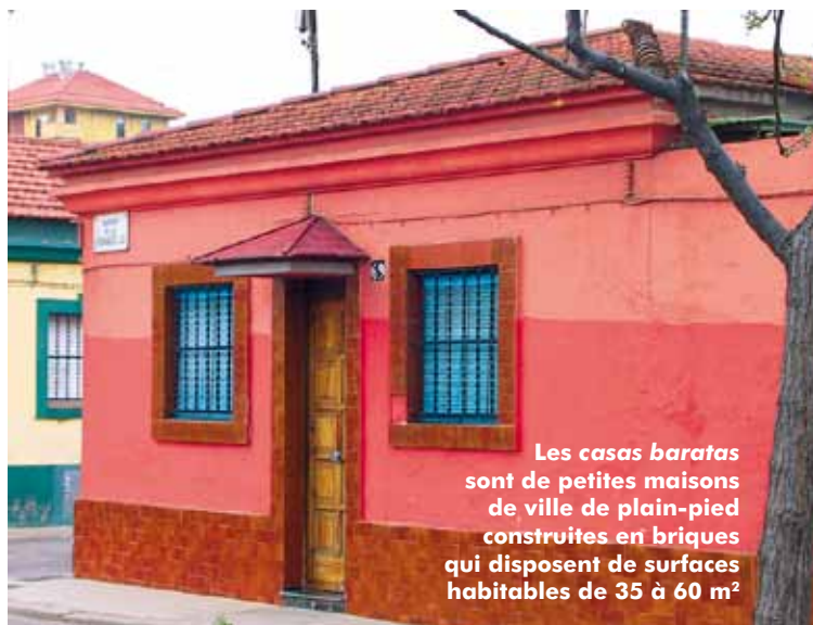
Les casas baratas sont de petites maisons de ville de plain-pied construites en briques qui disposent de surfaces habitables de 35 à 60 m 2